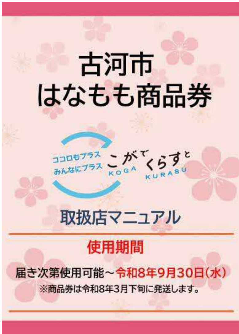
取扱店用マニュアル (本紙) 1部