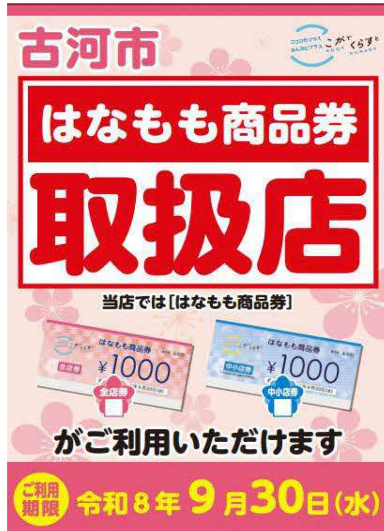
取扱店用ポスター2部

* 利用可能な券種が分かるよう、大型店は「全店券」にチェックを、それ以外の店舗は「全店券」「中小店券」にチェックして掲示してください。